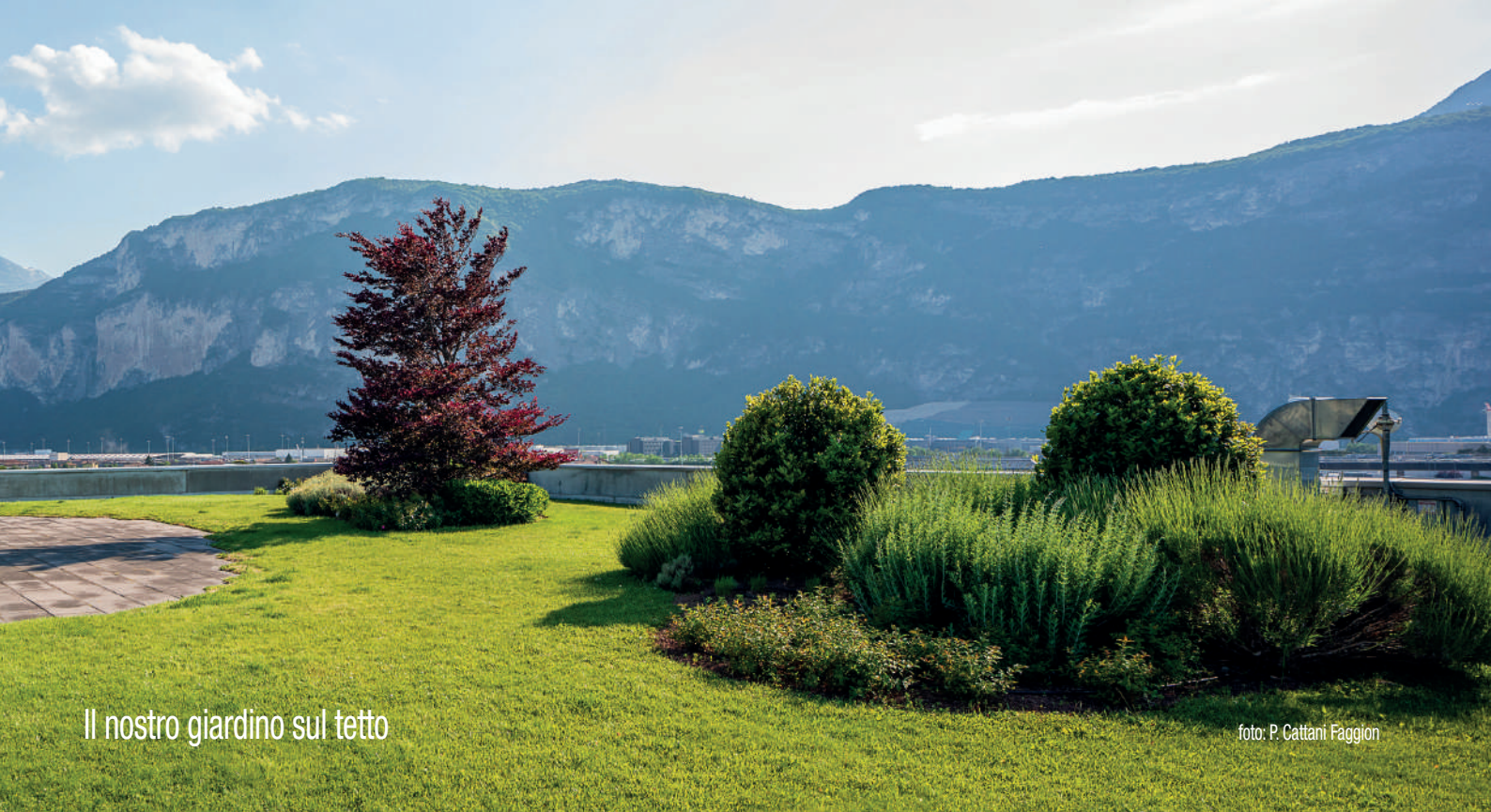
Il nostro giardino sul tetto