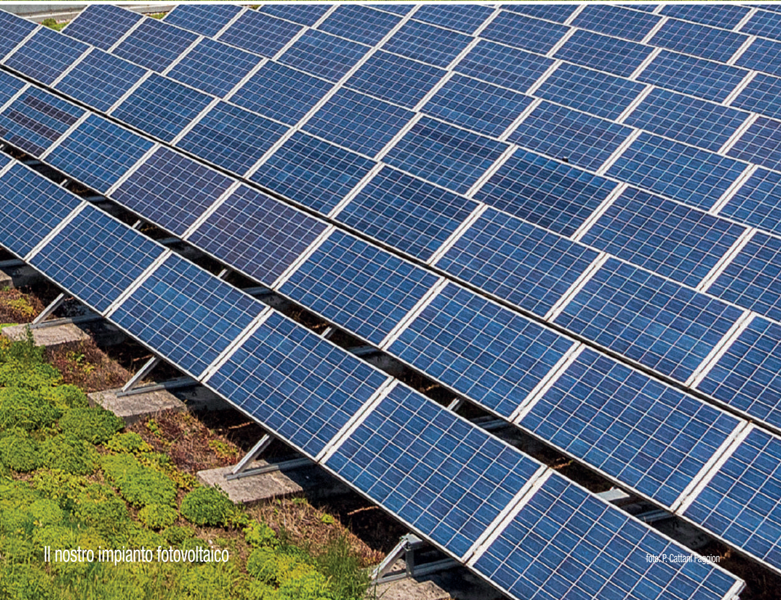
Il nostro impianto fotovoltaico